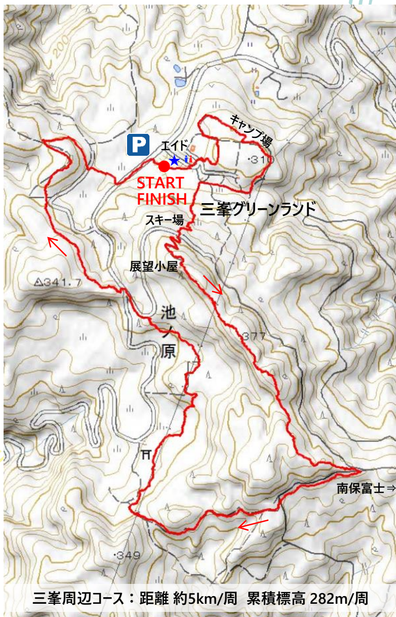
三峯周辺コース: 距離 約5km/周 累積標高 282m/周

1周目は、キャンプ場をショートカットしてスキー場へ。展望小屋まで登り切れば、後はほぼ下りの走りやすいコース♪